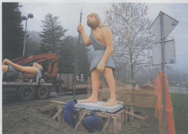
Jučer je kip učvršćen u beton i odmah je plijenio pažnju prolaznika

Pračovjek je prikazan u svijetlim nijansama žute i sive boje. Na licu mu se ističe brada, spojene guste obrve, širok nos, te bujna kosa. - Praljudi nisu bili erne puti, zato sam odabrao svijetle nijanse. Dobro sam proučio